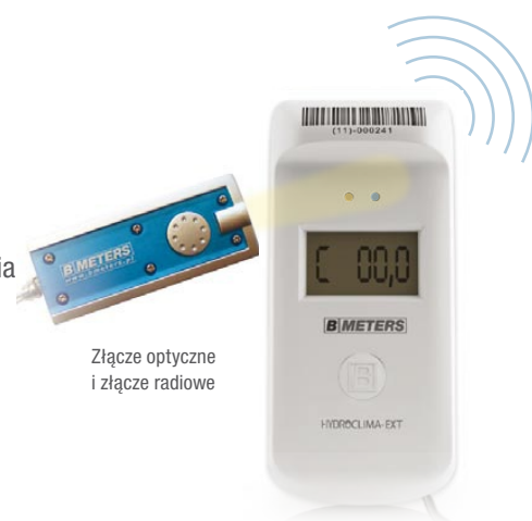
Złącze optyczne i złącze radiowe

Każdy podzielnik ze zdalnym czujnikiem temperatury wyposażony jest zarówno w moduł radiowy, jak i złącze optyczne. Oba rozwiązania pozwalają na komfortowy, elektroniczny odczyt danych, co skraca czas rozliczenia i obniża jego koszty. Zewnętrzny czujnik temperatury pozwala na pomiar temperatury grzejników, w przypadku których utrudniony jest dostęp do powierzchni grzejnej. Transmisja radiowa podzielona na dwa typy komunikatów jest dowolnie konfigurowalna. Podzielnik HYDROCLIMA-EXT zapisuje w pamięci dane pozwalające na dokonanie pełnej analizy warunków w jakich pracował przez cały sezon. Analiza ta jest możliwa poprzez rejestrację m.in. takich danych jak ilość pomiarów w 4 różnych zakresach temperatur.